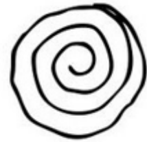
un trou d'eau