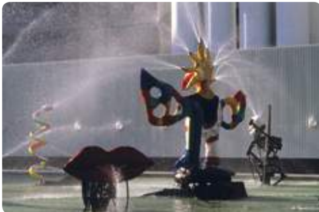
Niki de Saint Phalle, L'oiseau de feu, La Fontaine Stravinsky, Paris

Elle a également réalisé un jardin composé de sculptures monumentales : le Jardin des Tarots, en Italie (en Toscane). Elle a vécu dans ce jardin avec sa famille, tout en le réalisant. Elle habitait dans une sculpture qui s'appelle L'Impératrice . Ce chantier a démarré en 1978 et le jardin a ouvert ses portes en 1998. Ça a été une œuvre et un travail gigantesque.