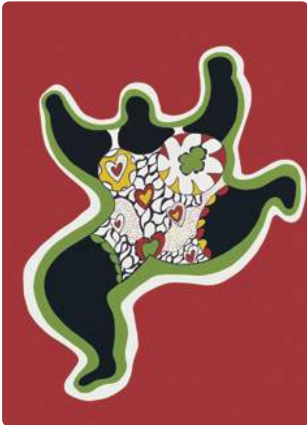
Niki de Saint Phalle, Nana Power , 1970, sérigraphie ©2018 Niki Charitable Art Foundation/ Adagp, Paris

Parmi ses sculptures les plus célèbres, il y a sa série des Nanas . Ce sont des sculptures de femmes, très grandes, puissantes, chahuteuses, dansantes, avec des couleurs vives. Chacune de ses Nanas a un prénom. Par exemple, cette statue s'appelle Bloum .