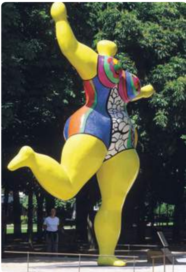
Niki de Saint Phalle, Nana jaune ©2018 Niki Charitable Art Foundation/ Adagp, Paris

Parmi ses sculptures les plus célèbres, il y a sa série des Nanas . Ce sont des sculptures de femmes, très grandes, puissantes, chahuteuses, dansantes, avec des couleurs vives. Chacune de ses Nanas a un prénom. Par exemple, cette statue s'appelle Bloum .