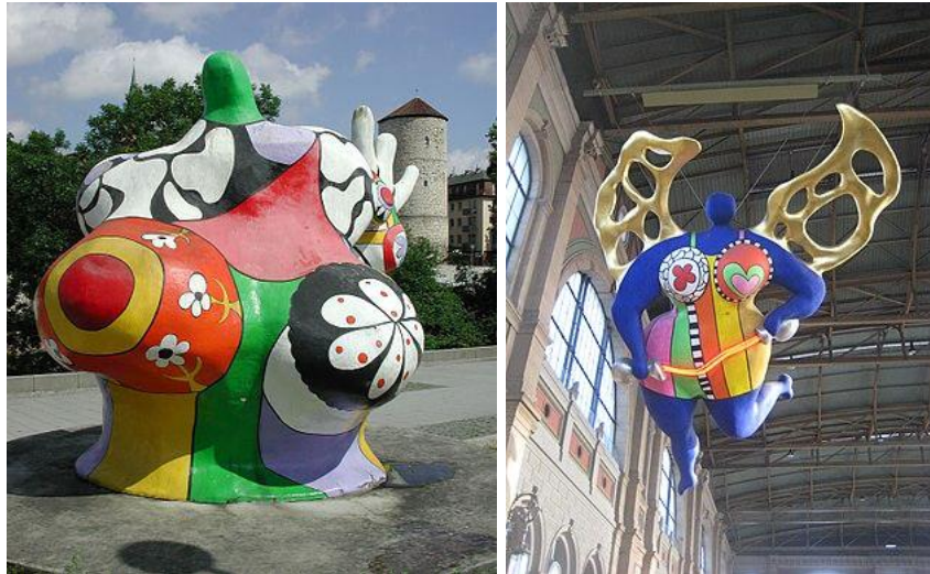
Une Nana, en Allemagne L'Ange protecteur

Niki de Saint Phalle est surtout reconnue pour ses sculptures modernes. Son style est très reconnaissable, caractérisé par des personnages aux formes rondes et voluptueuses, les Nanas . Celles-ci sont exposées dans l'espace public et dans les plus grands musées mondiaux, comme le Jardin des Tarots ( Toscane ) créé par le couple. Les jardins des Tarots ont été réalisés entre 1979 et 1983. Elle s'est inspirée de vingt-deux arcanes (symbole de jeux de tarot). Elle a eu l'aide de Jean Tinguely qui réalisa les structures. Les jardins ont ouvert en 1998. On peut rentrer à l'intérieur de ces immenses sculptures, certaines peuvent atteindre 15 mètres, on voit des arcanes. Voilà pourquoi on l'appelle jardins des tarots. La structure est faite en métal recouvert de béton et sur le béton on a mis de la céramique polychrome. Elles sont habitables. Il y a un mur qui entoure le parc pour séparer les visiteurs de la réalité. D'autres sont aussi visibles devant le bâtiment moderne du centre Pompidou , c'est la fontaine des automates .