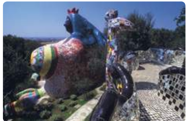
Niki de Saint Phalle, Le Jardin des tarots , Italie ©2018 Niki Charitable Art Foundation/Adagp, Paris

Niki de Saint Phalle a réalisé de nombreux projets, dont des grands projets architecturaux, des sculptures-architectures, comme des fontaines.