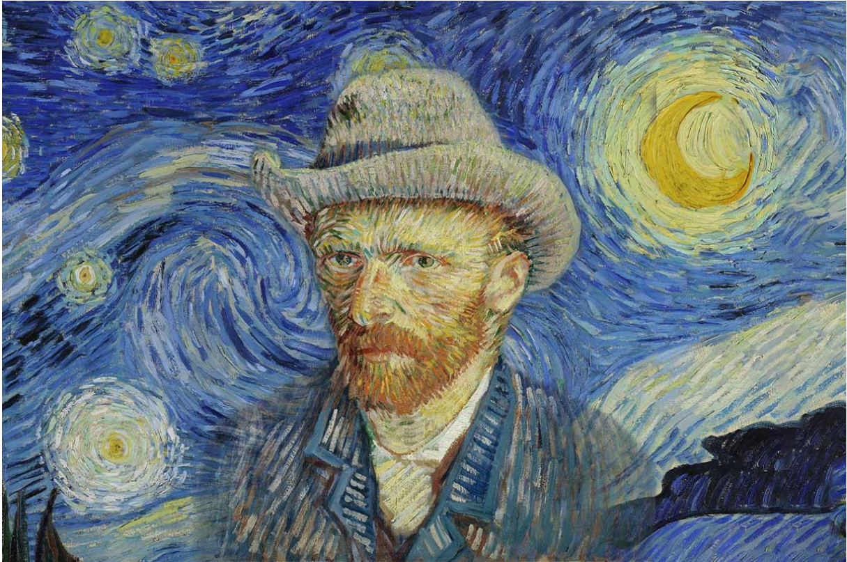
Autoportrait – Vincent Van Gogh