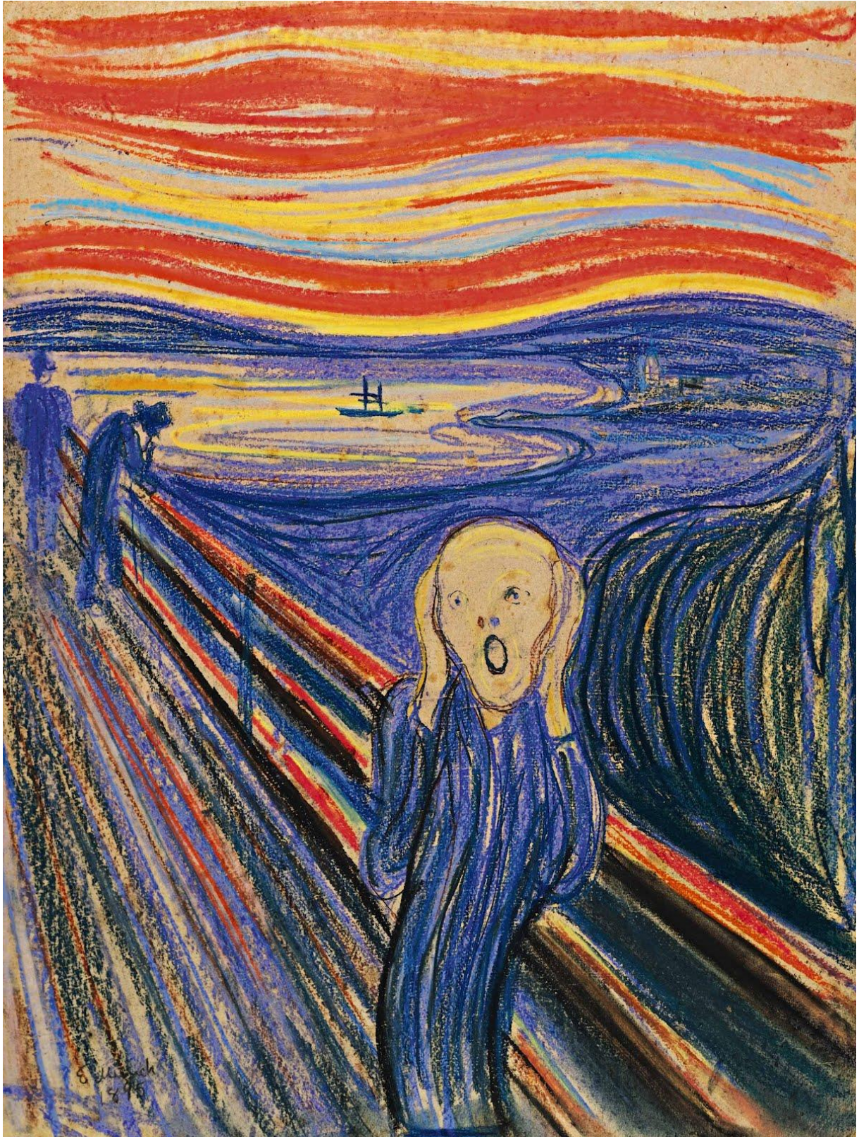
Le cri – Edvard Munch