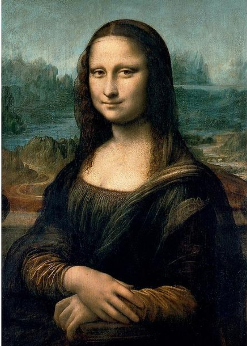
La Joconde – Leonard de Vinci