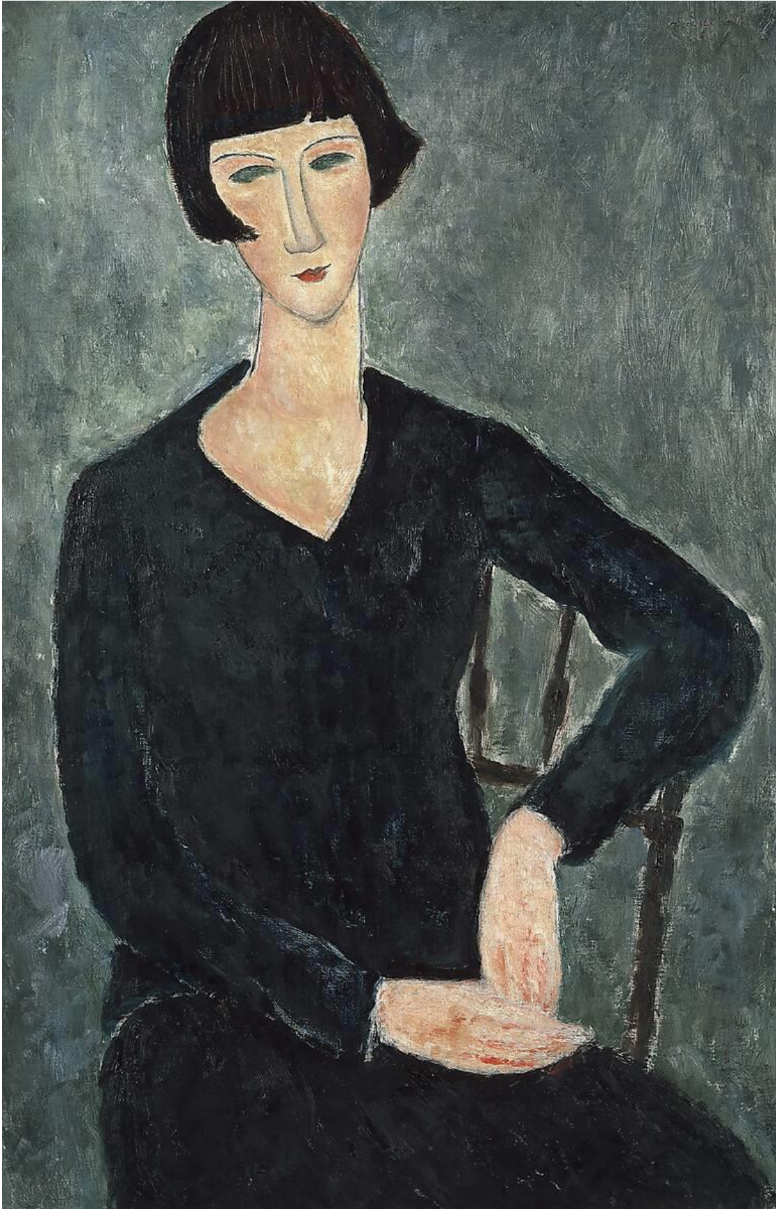
Amedeo Modigliani – Femme assise avec veste bleue