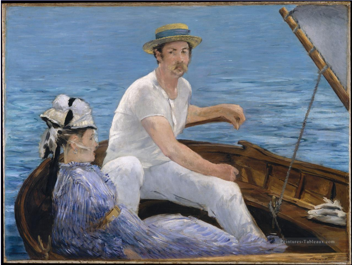
Bateau - Edouard Manet