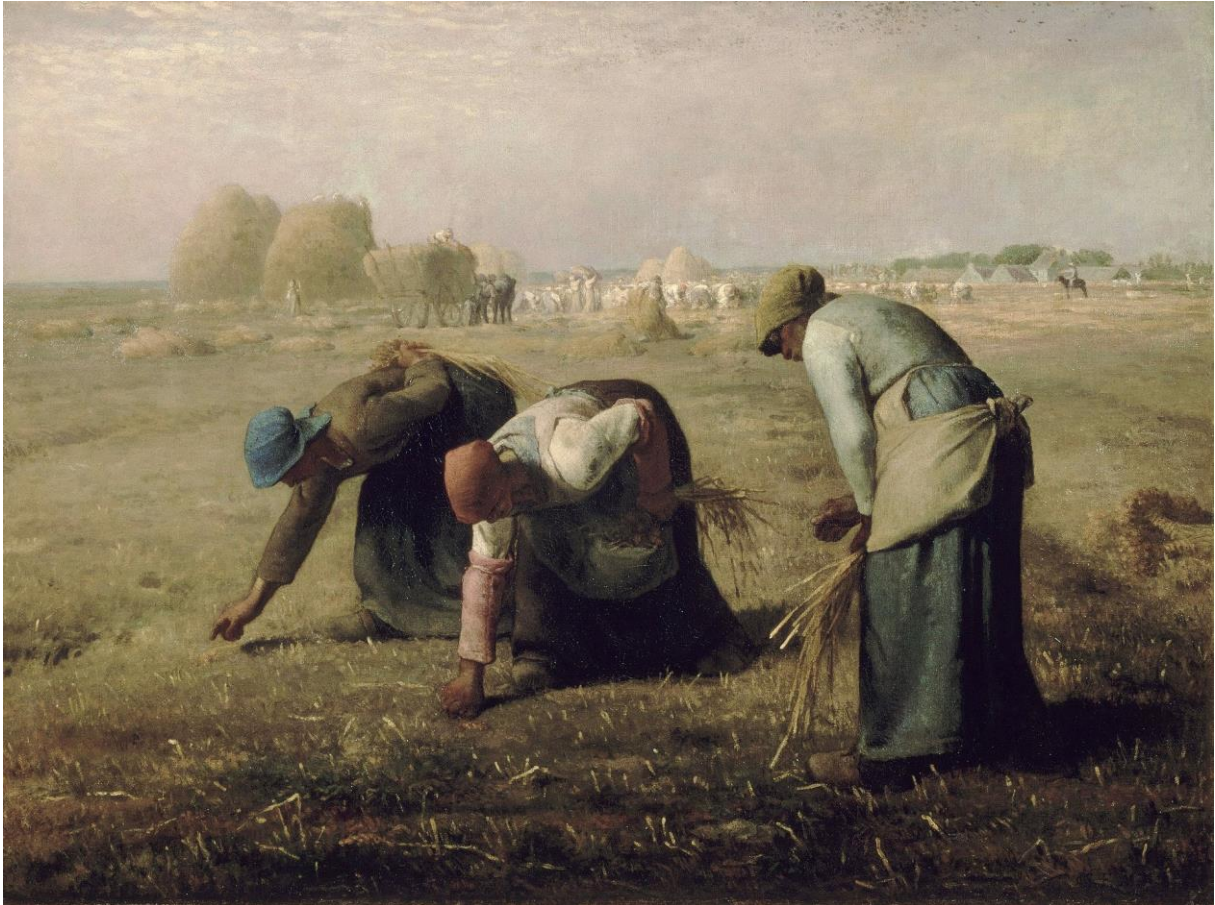
Les glaneuses – Jean-François Millet