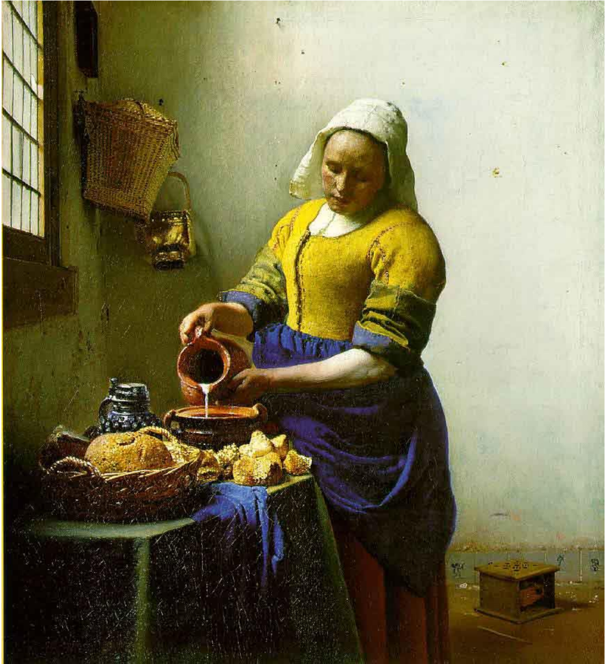
La laitère – Johannes Vermeer