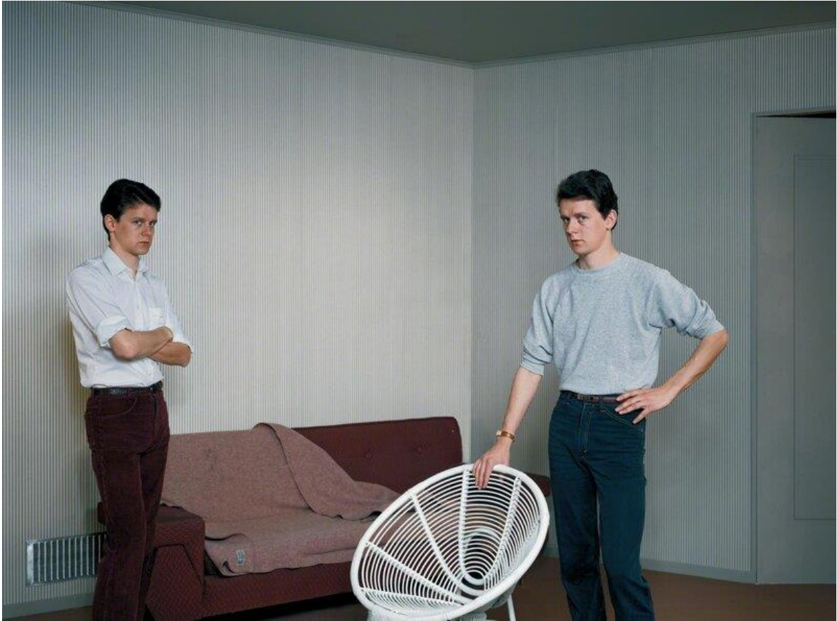
Double self portrait – Jeff Wall