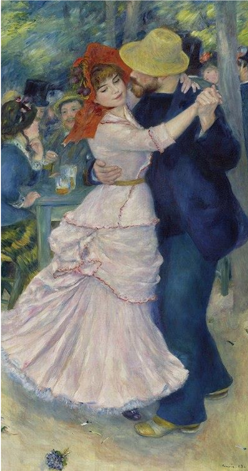
Danse à Bougival – Pierre-Auguste Renoir