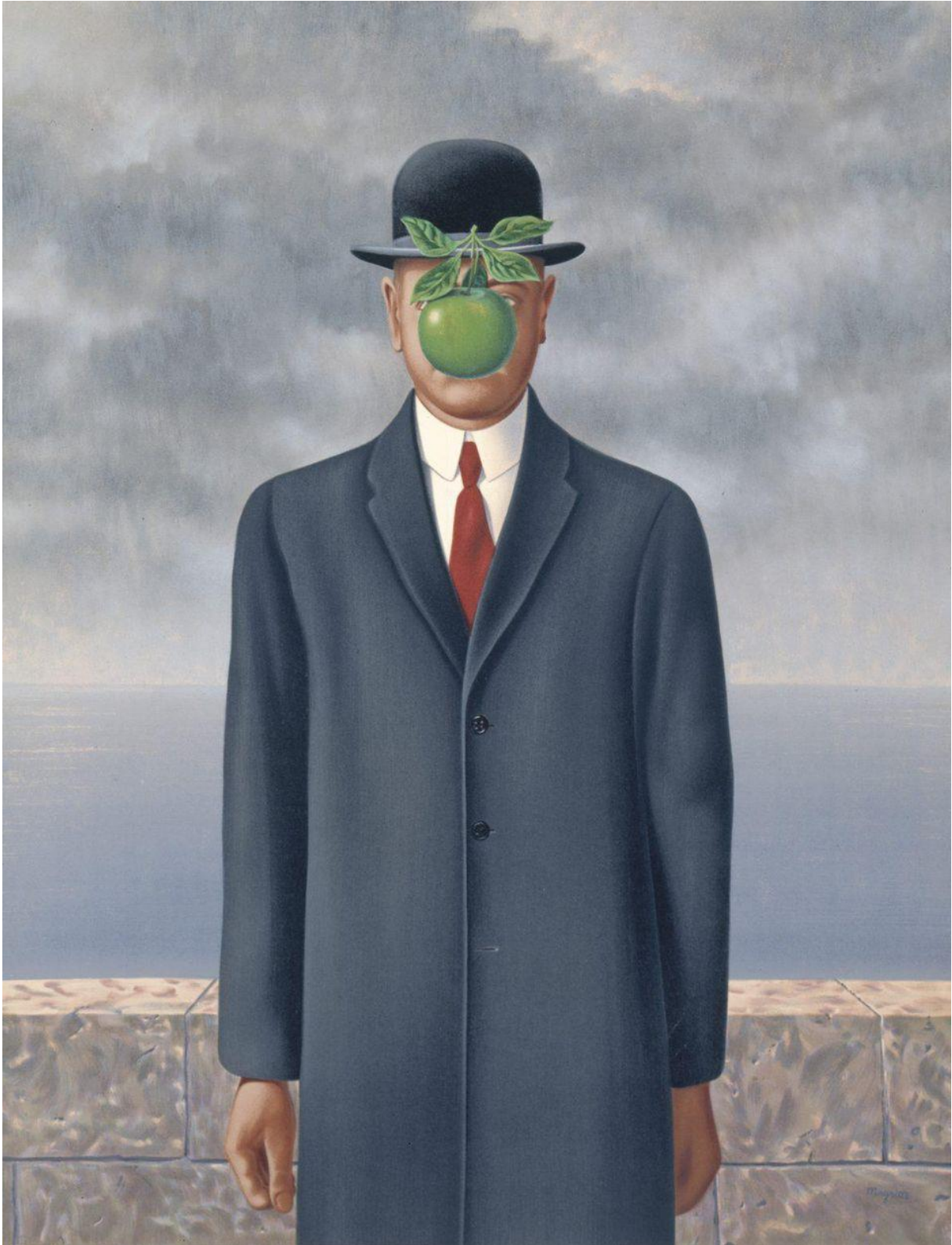
Le fils de l'Homme – Magritte