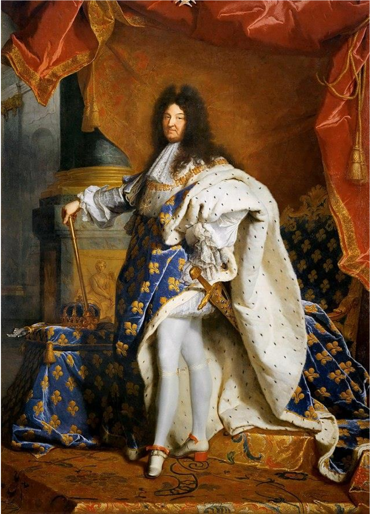
Portrait de Louis XIV – Hyacinthe Rigaud