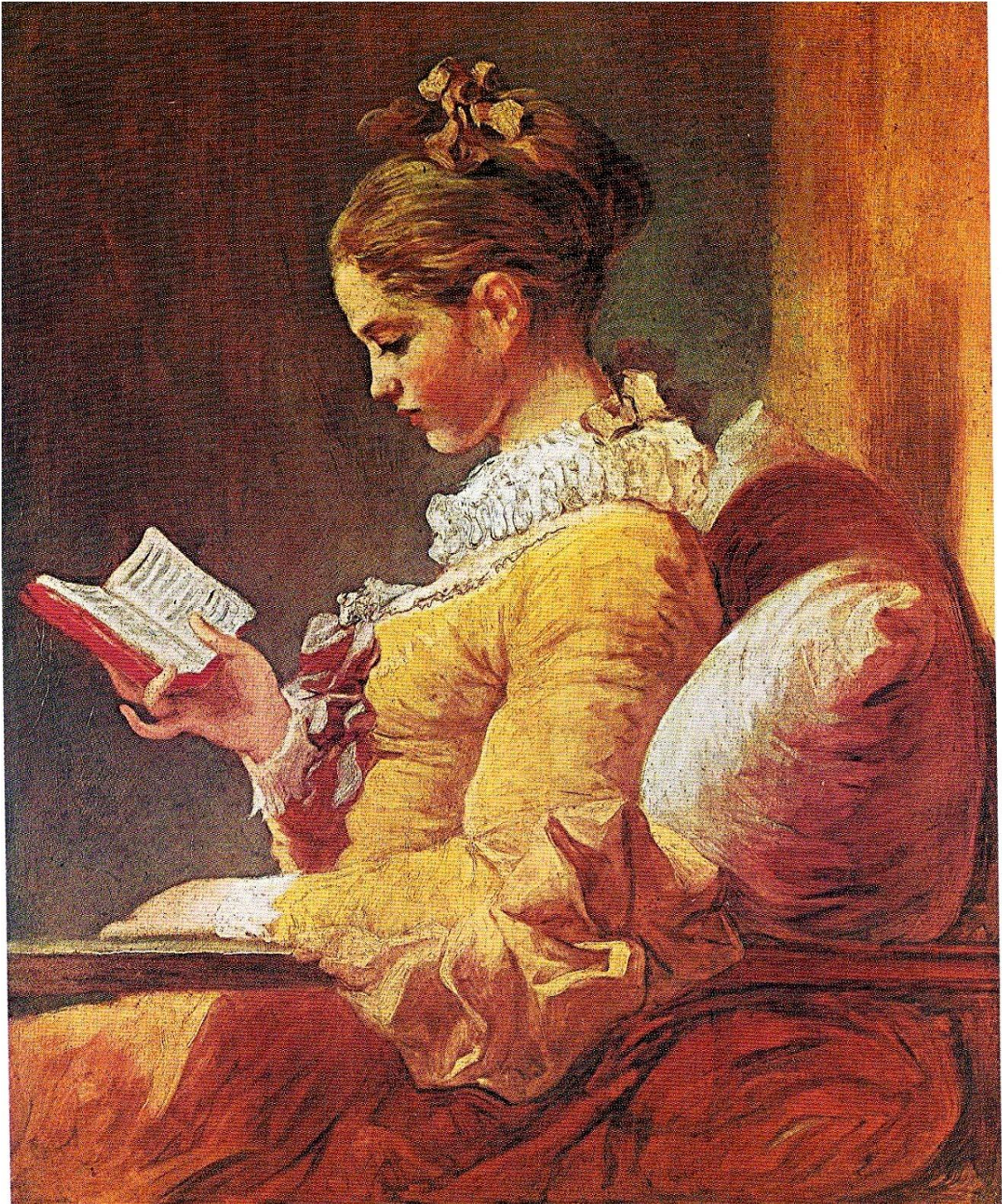
La liseuse – Jean-Honoré Fragonard