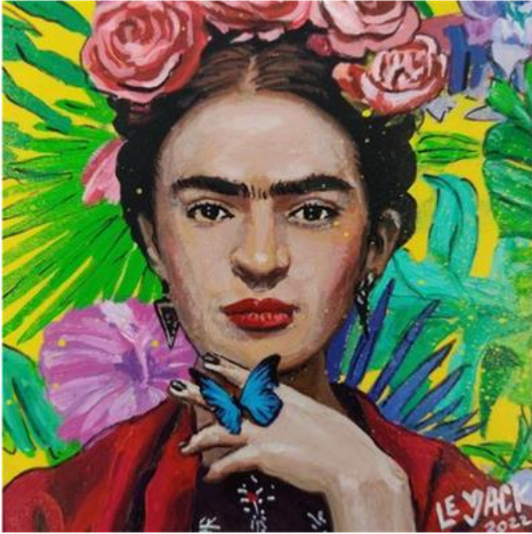
Autoportrait – Frida Kahlo