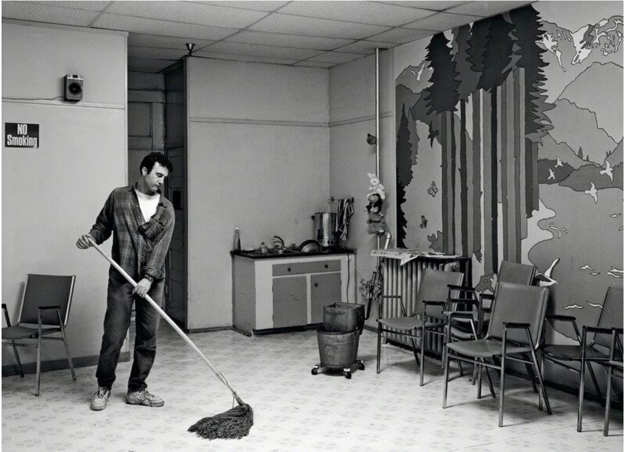
Volunteer – Jeff Wall