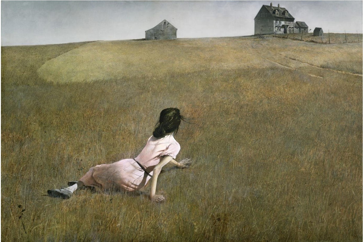
Christiana's world – Andrew Wyeth