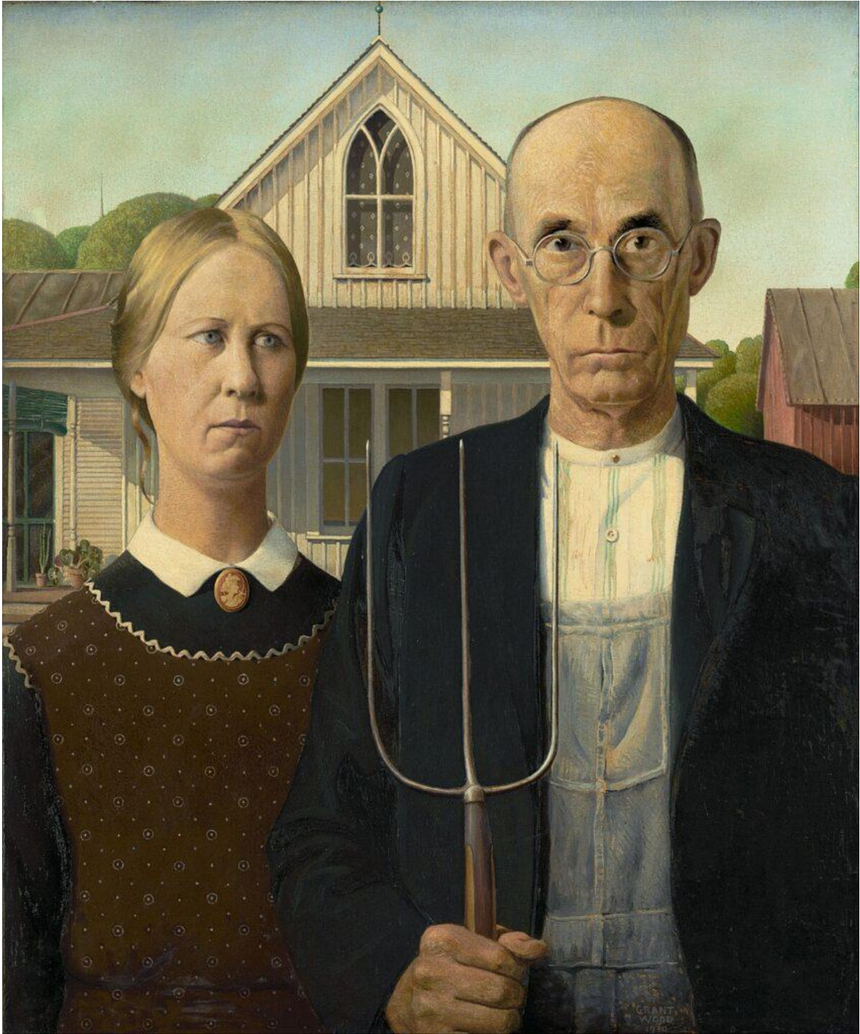
American gothic – Grant Wood