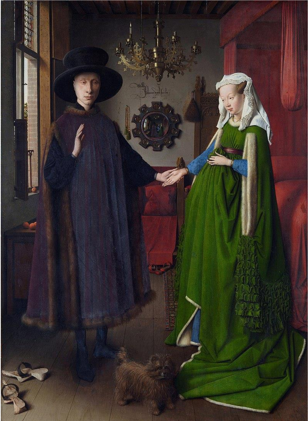
Les époux Arnolfini – Jan Van Eyck