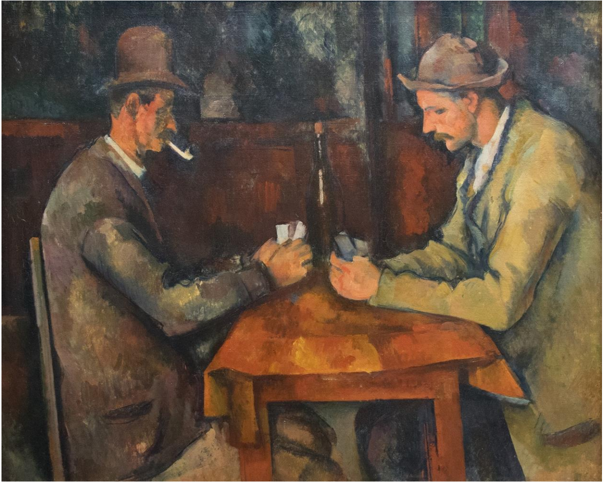
Les joueurs de cartes – Paul Cézanne