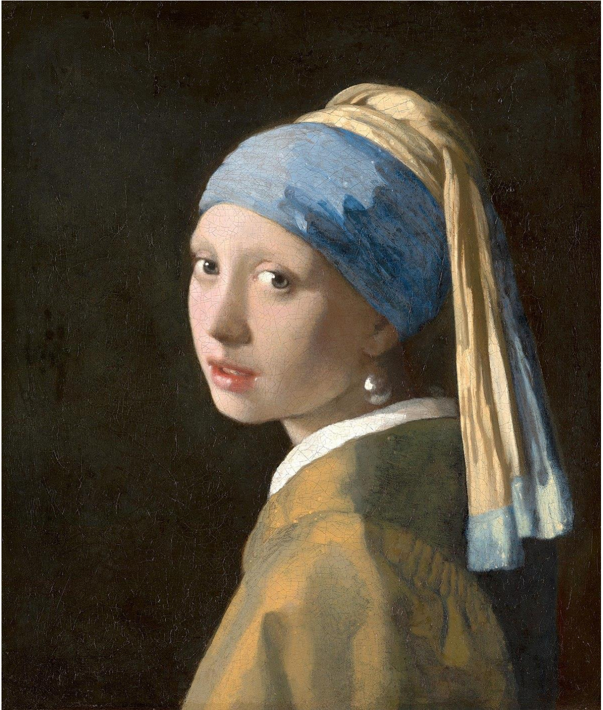
Jeune fille à la perle – Johannes Vermeer