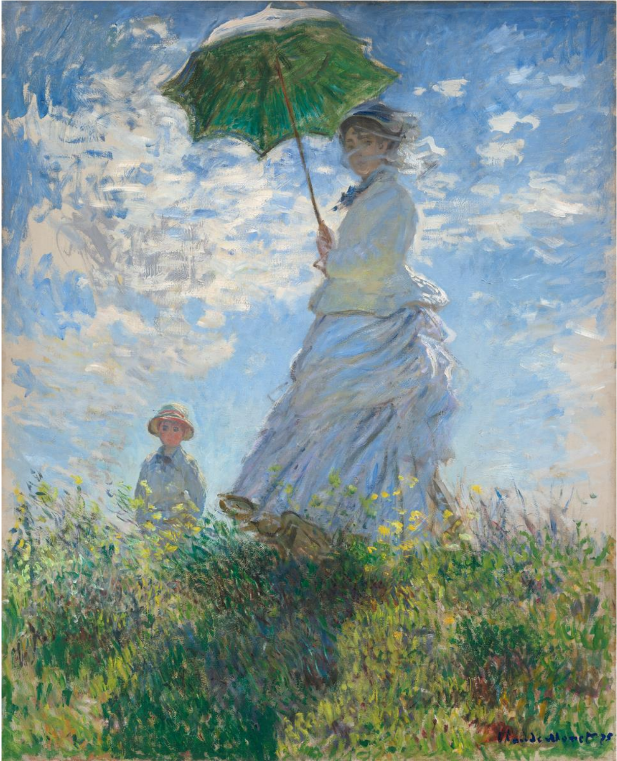
La promenade – Claude Monet